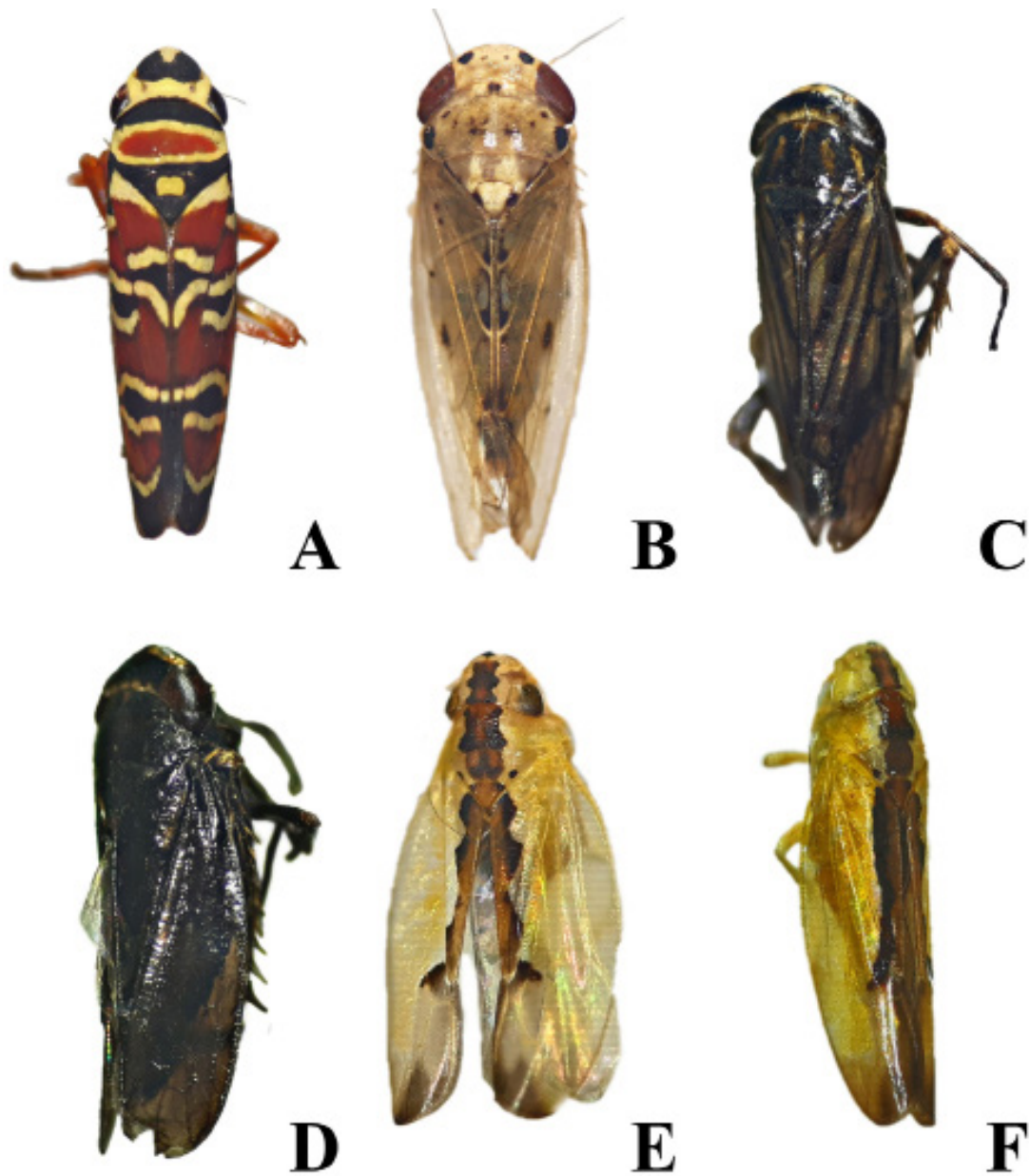
Figura 3. Nuevos registros de cicadélidos para el estado de Yucatán. (A) Agrosoma pulchella (Guérin-Méneville, 1829); (B) Ollarianus insignis DeLong, 1944; (C) Exitianus nigrens DeLong & Hershberger, 1947; (D) E. picatus (Gibson, 1919); (E) Neocoelidia mexicana (DeLong, 1953); (F) N. barretti Baker, 1898.