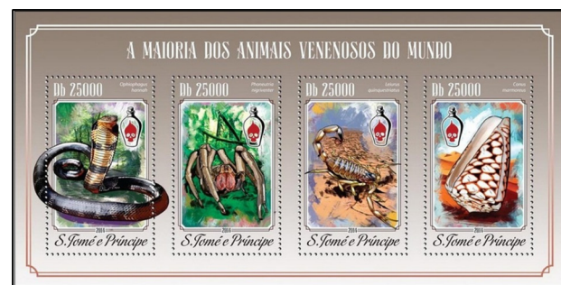
Figura 4. Leiurus quinquestriatus Hemprich & Ehrenberg, 1829 dentro de los animales más venenosos del mundo.