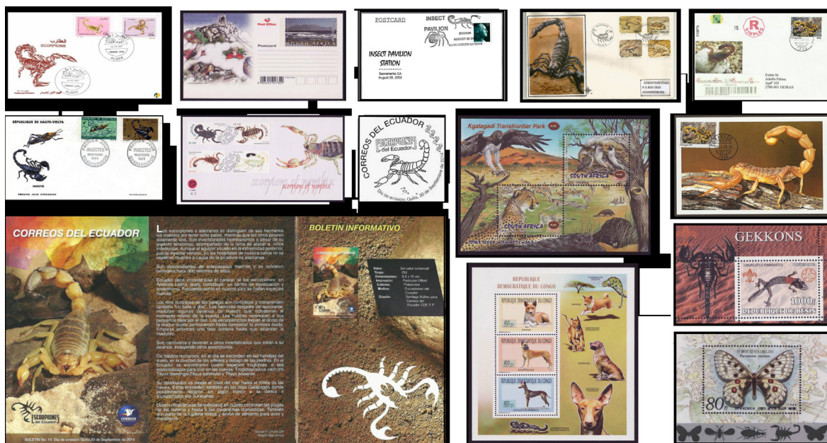
Figura 2. Documentos postales con la imagen de especies de alacranes