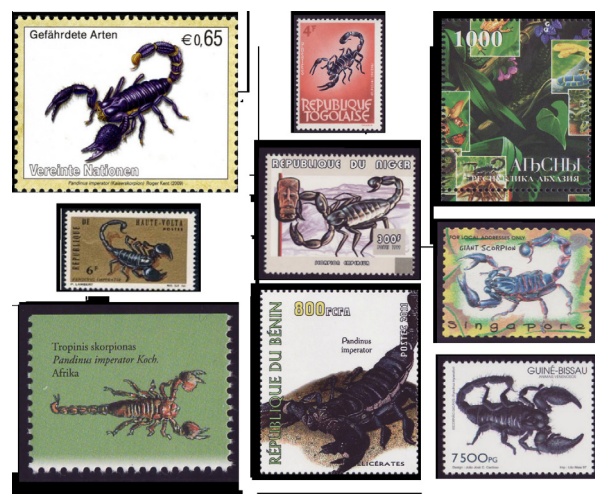
Figura 1. Sellos con la imagen de Pandinus imperator (Koch, 1841).

cinco carecen de elementos taxonómicos característicos que permitan ubicarla en alguna especie conocida, los cuales fueron emitidos por Afganistán (1986), Madagascar (1999), Somalia (2000), Eritrea (2001) y Portugal (2011). De los sellos en los que se reconocen taxonómicamente a las especies, se documentan a cuatro de las seis superfamilias de estos arácnidos y seis de las 16 familias existentes. Así mismo, se exponen 19 de los 155 géneros y 31 especies de las aproximadamente 2231 registradas a nivel mundial (Cuadro 1). La superfamilia mejor representada es Buthoidea (21 sellos), a través de la familia Buthidae. El género con mayor cantidad de emisiones resultó ser Pandinus (10 sellos), mientras que Pandinus imperator (Koch, 1841) fue la especie mejor representada con nueve de los sellos postales a nivel mundial (Fig. 1). Aunado a