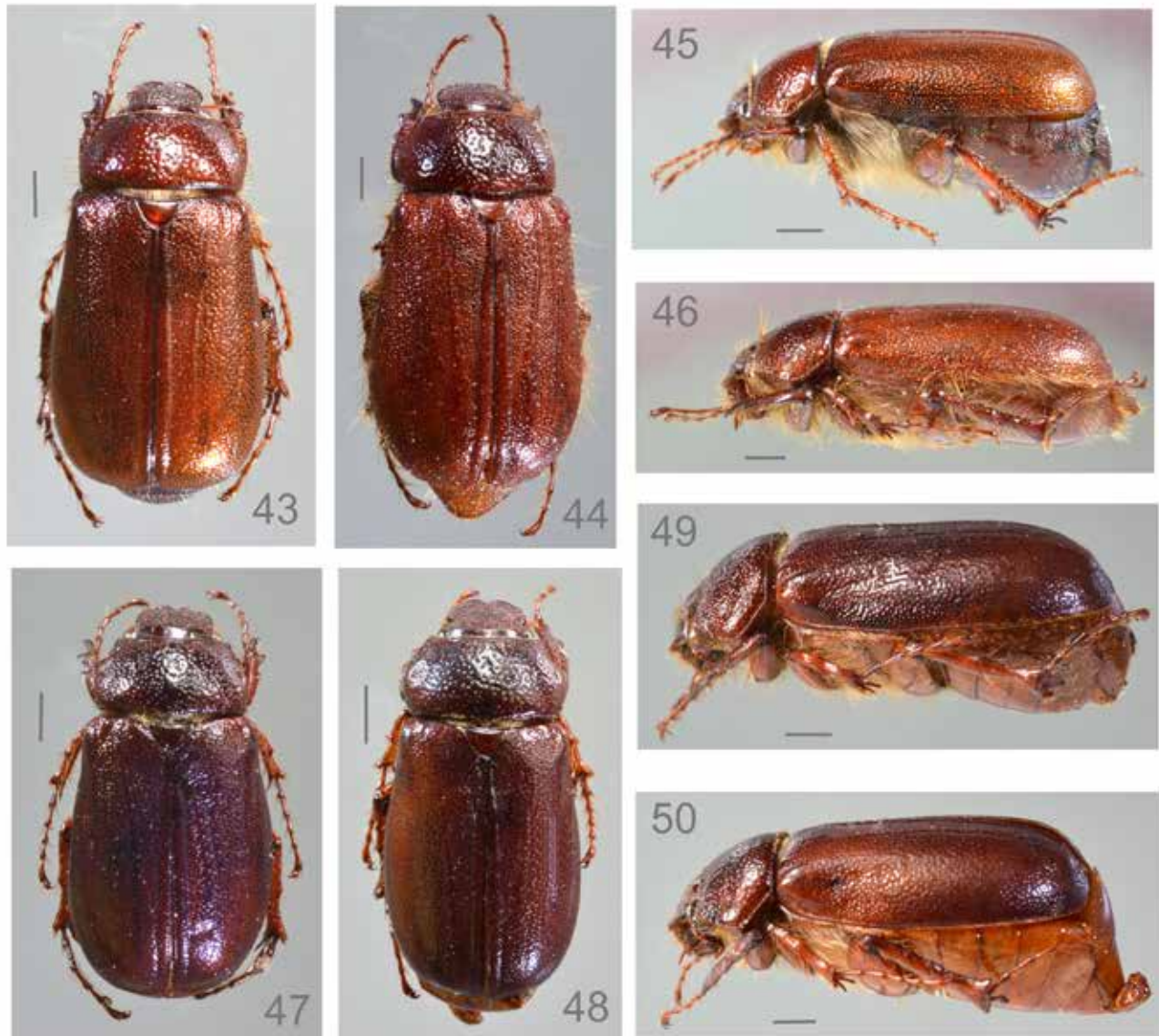
Figuras 43-46. Phyllophaga sahadundinoi , macho: 43) dorsal. 45) lateral. Hembra: 44) dorsal, 46) lateral. Figs. 47-50. P. xalacoatepecana , macho: 47) lateral. 49) dorsal. Hembra: 48) dorsal. 50) lateral. Líneas de escala = 2 mm.