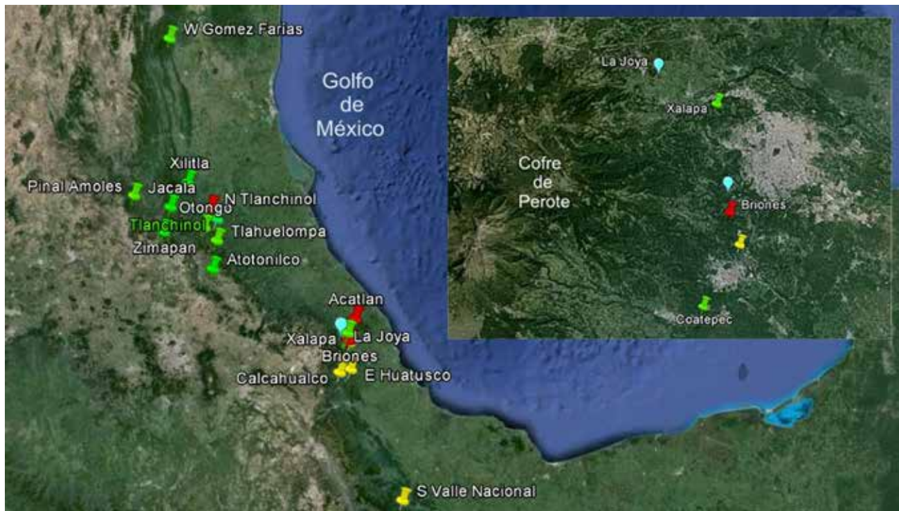
Figura 51. Distribución de nuevas especies de Phyllophaga en el oriente de México. P. clavijeroi (amarillo); P. edrileyi (verde); P. sahadundinoi (rojo); P. xalacoatepecana (azul). Mapa modificado de Google Earth 4/09/13.