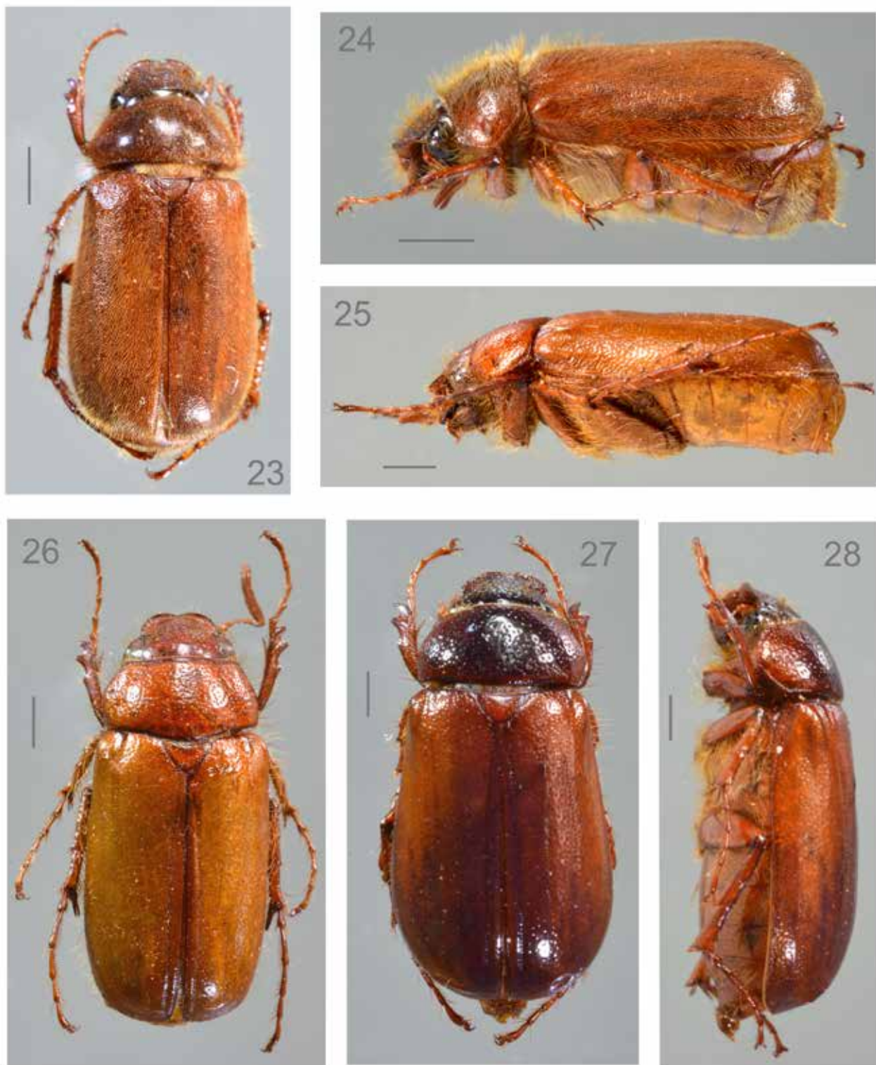
Figuras 23-24. Phyllophaga clavijeroi , Briones, Ver., macho: 23) dorsal. 24) lateral. Figs. 25-28. P. edrileyi , Pinal de Amoles, Qro., macho 25) lateral. 26) dorsal. Briones, Ver., hembra: 27) dorsal. 28) lateral. Líneas de escala = 2 mm.