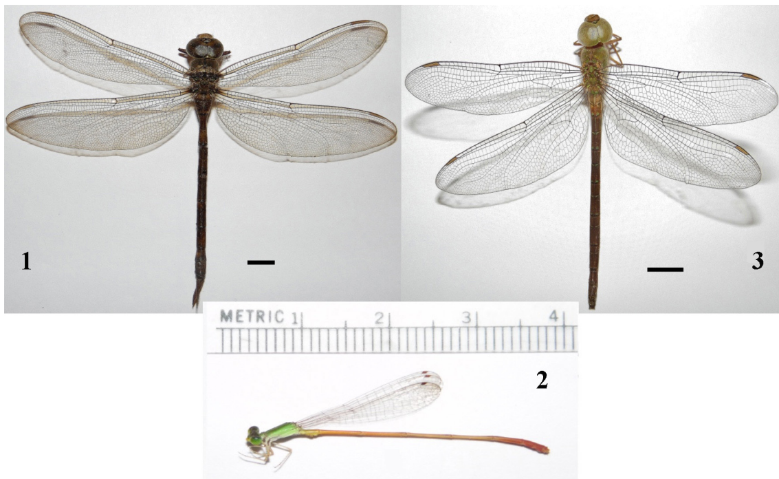
Figuras 1-3. 1) Gynacantha mexicana (macho). 2) Leptobasis vacillans (macho). 3) Triacanthagyna septima (hembra). Marca de escala 1 cm.