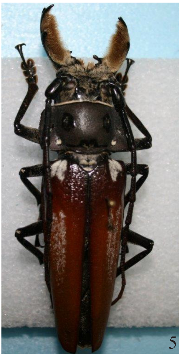
Figuras 2-4. Callipogon senex . 2. En cautiverio. 3. Adulto dentro de árbol hospedero. 4. Larva en tronco de árbol hospedero. 5. Adulto en la colección entomológica del IMECBIO.