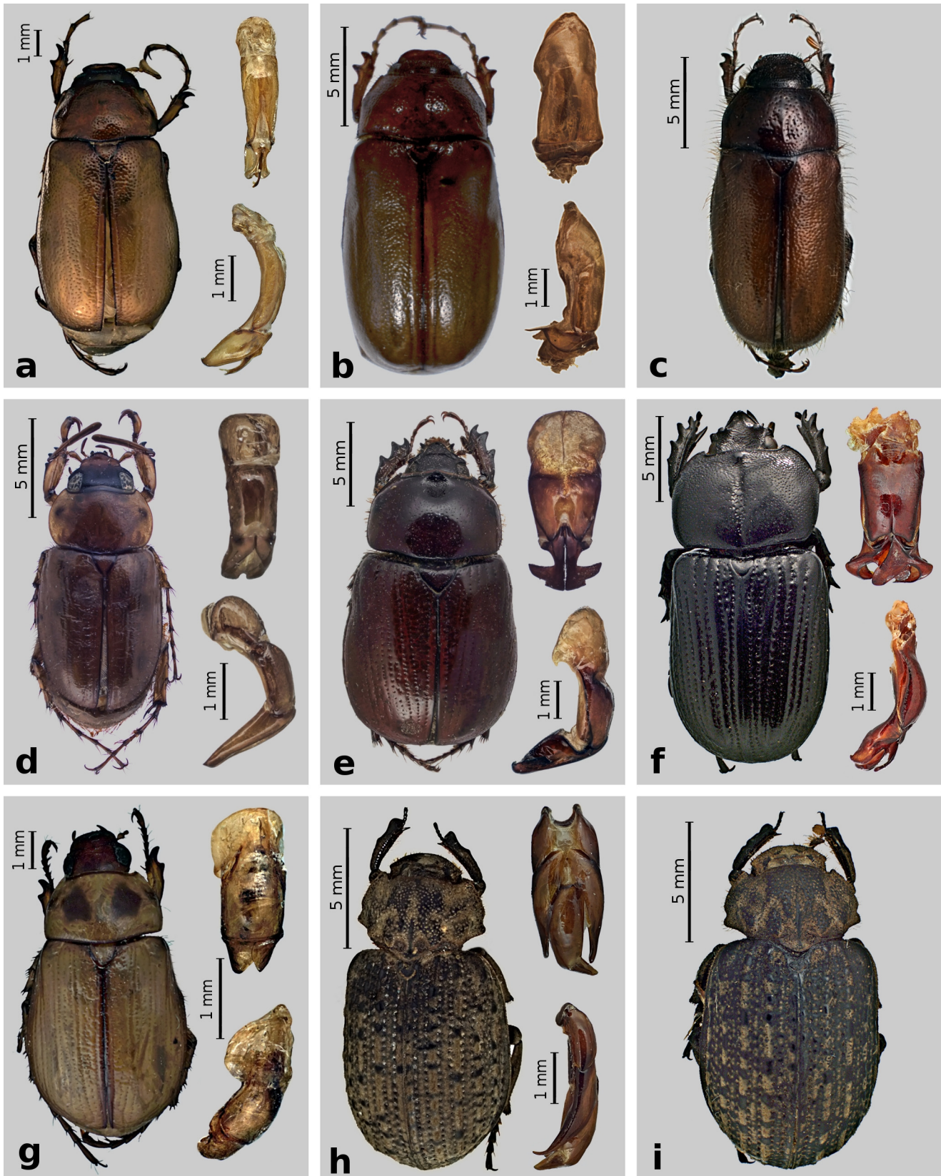
Figura 2. Adultos y cápsulas genitales de especies de Scarabaeoidea recolectadas en las islas de las Bahías de Ohuira y Navachiste, Sinaloa. a) Phyllophaga yaqui , b) Ph. ravida , c) Ph. cazieriana , d) Cyclocephala sinaloae , e) Oxygryllus ruginasus , f) Phileurus valgus , g) Paranomala flavilla , h) Omorgus suberosus y i) Omorgus tessellatus .

Paranomala Casey, 1915. De acuerdo con Ramírez-Ponce y Morón (2009) la mayor parte de las especies americanas